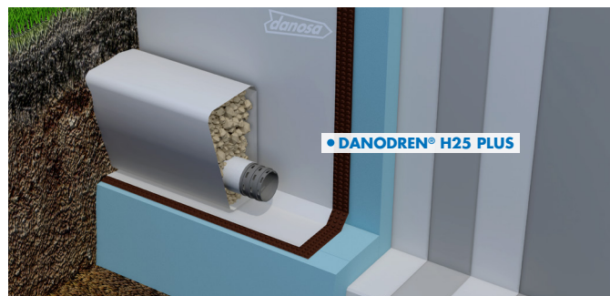
Muro flexorresistente con PVC