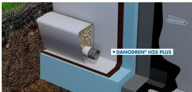
Muro flexorresistente con LBM (SBS)