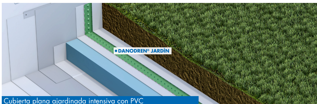
Cubierta plana ajardinada intensiva con PVC