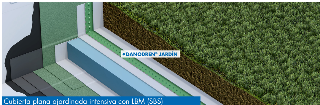
Cubierta plana ajardinada intensiva con LBM (SBS)